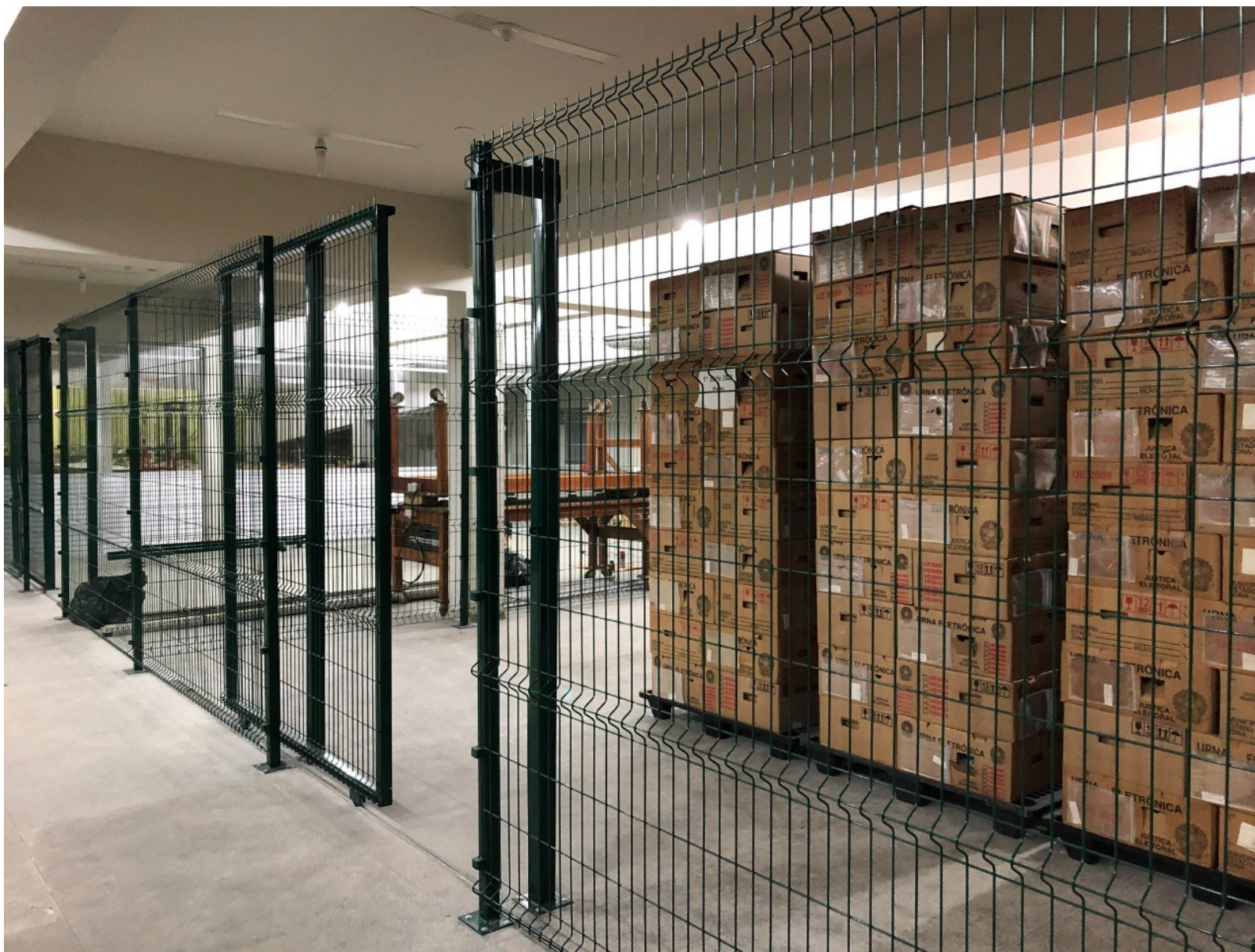
Imagem 08 – Área de armazenamento de urnas