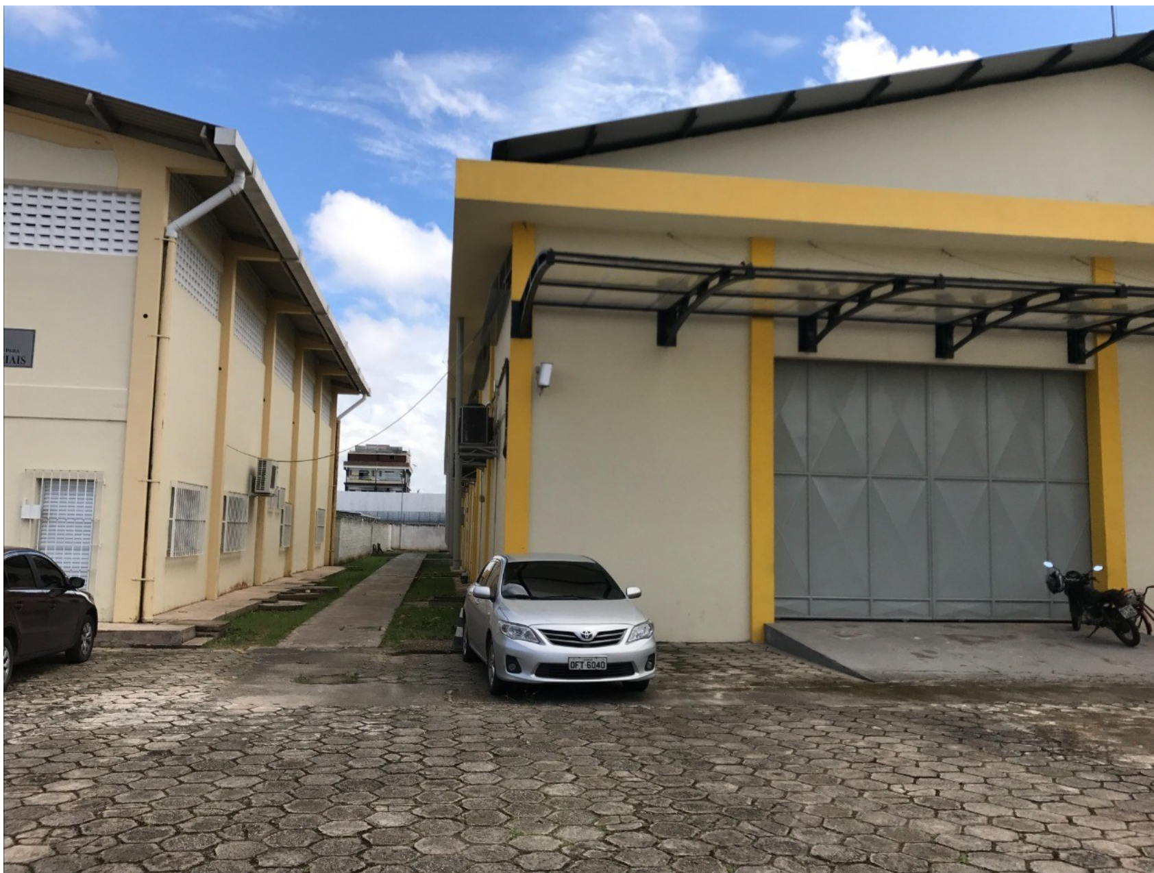
Imagem 03 – Fachada externa – Visão da Lateral do núcleo