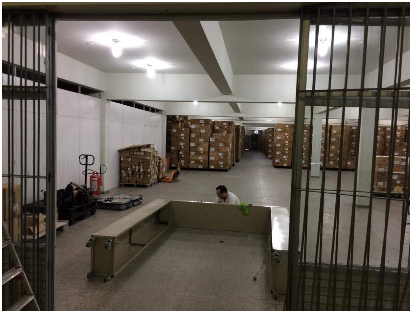
Imagem 11 – Colaborador atuando na manutenção de Portal RFID. Armazenamento de urnas ao fundo.