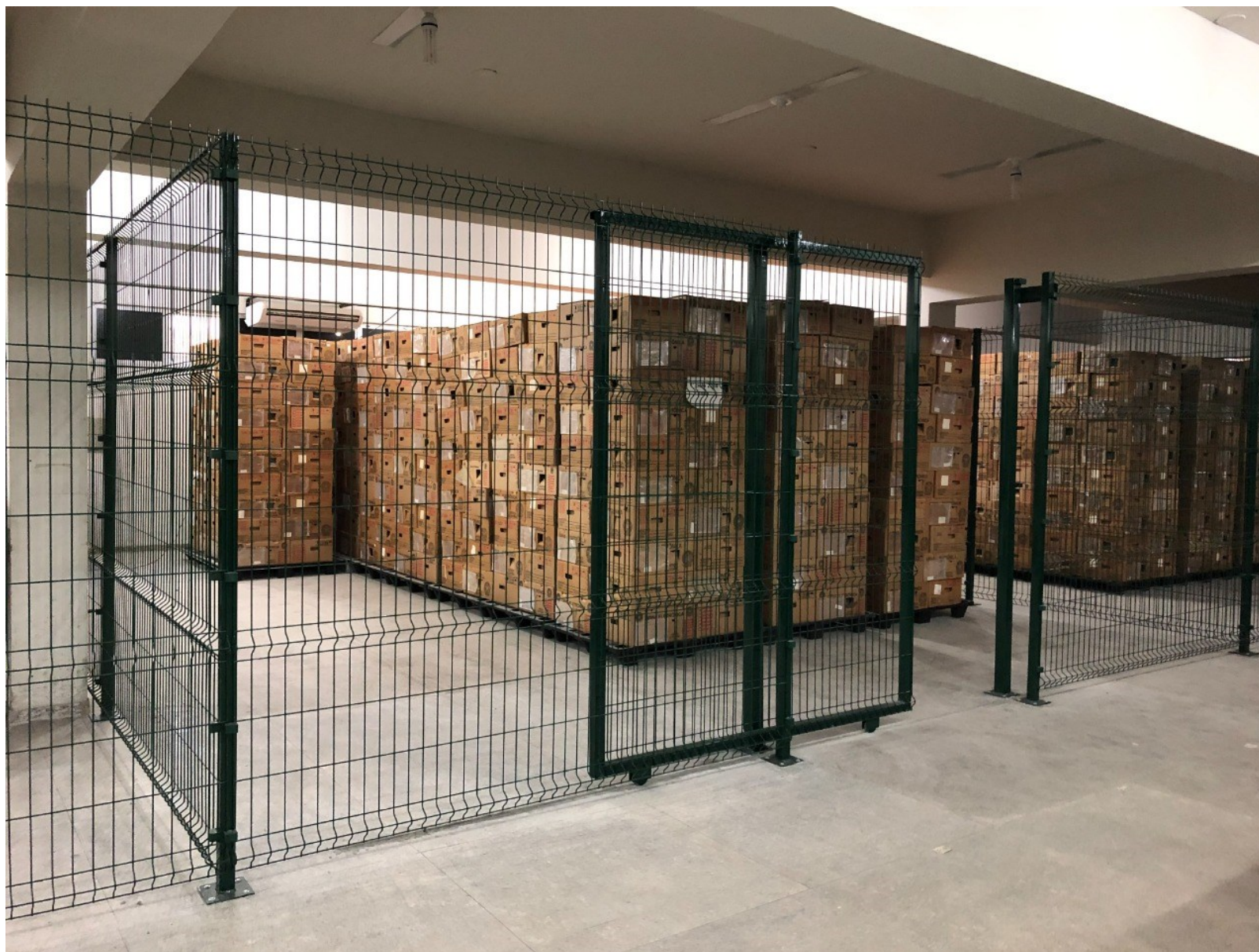
Imagem 07 – Área de armazenamento de urnas