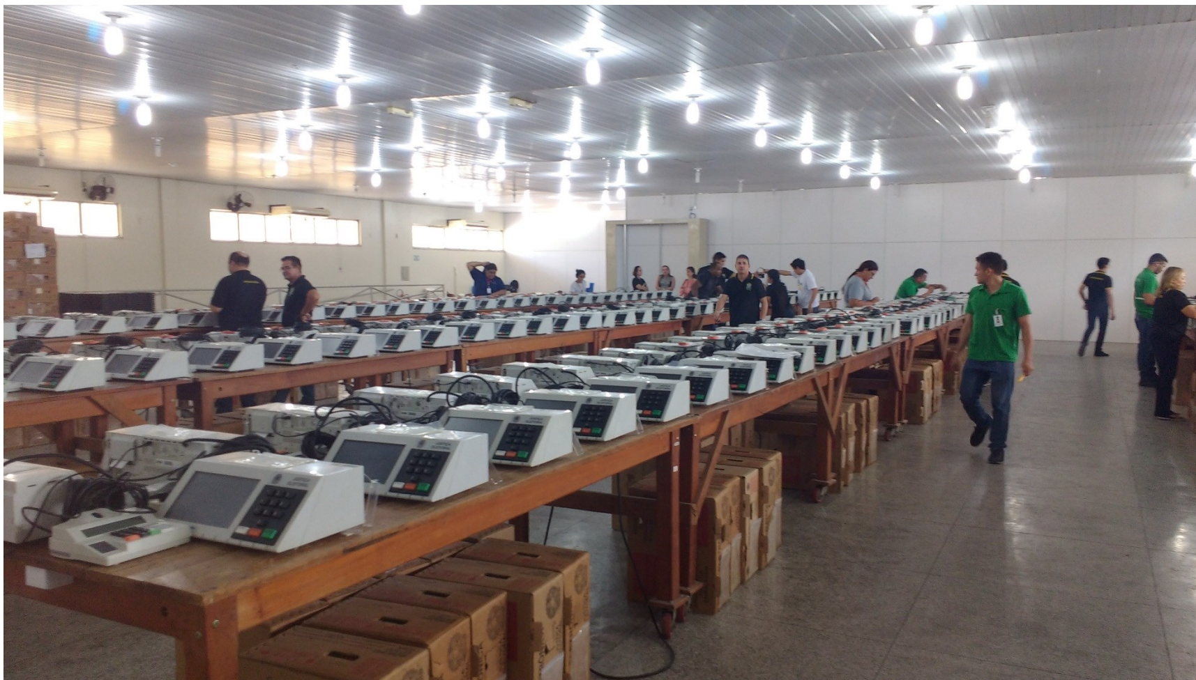
Imagem 12 – Colaboradores atuando em simulados de hardware da Justiça Eleitoral.