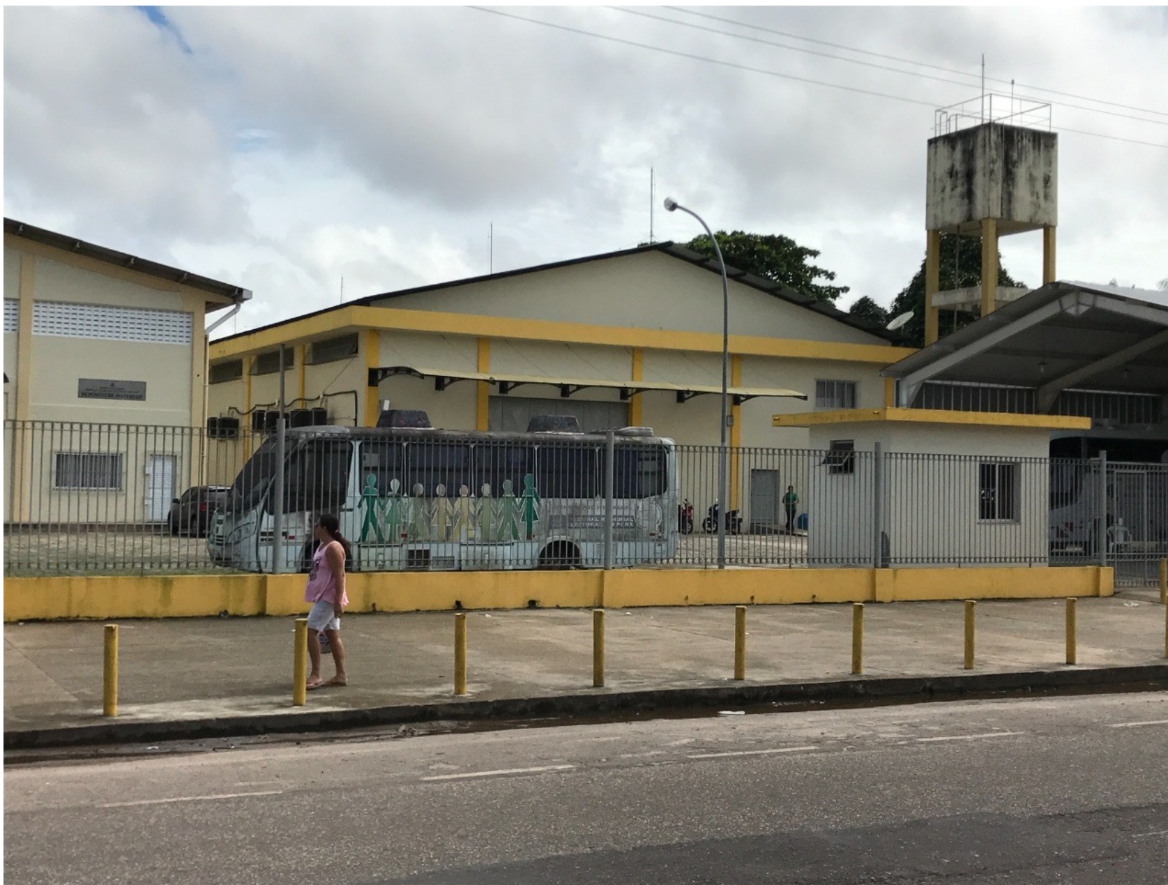
Imagem 01 – Fachada externa – Visão da Rua. Observar a guarita à entrada do Portão.