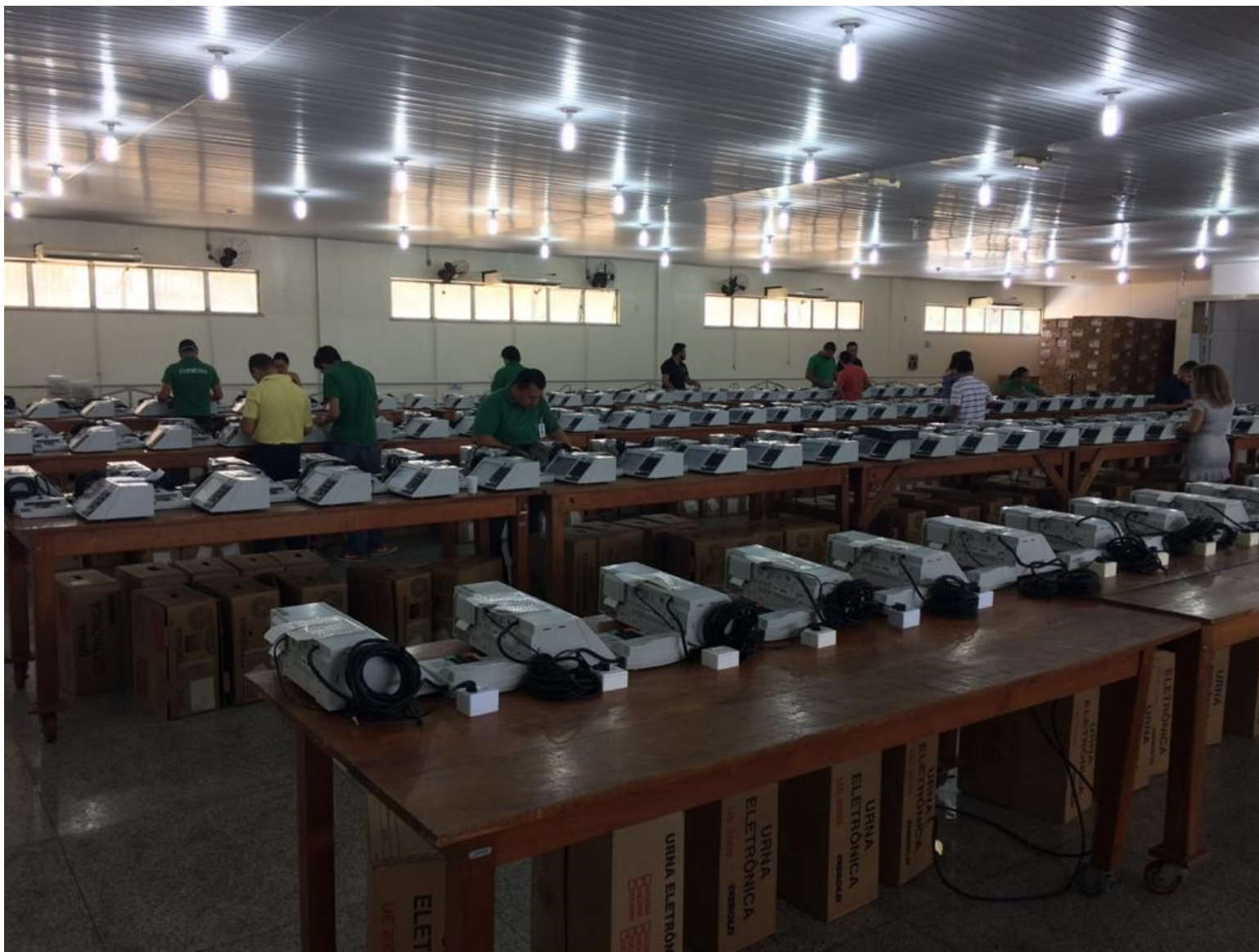
Imagem 10 – Colaboradores atuando na manutenção de urnas