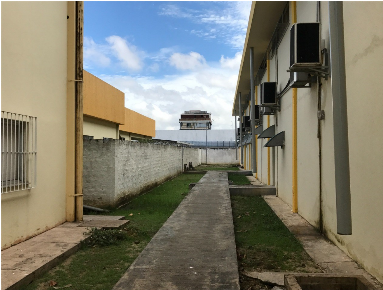
Imagem 04 –Lateral do núcleo com as calçadas de acesso às duas portas laterais