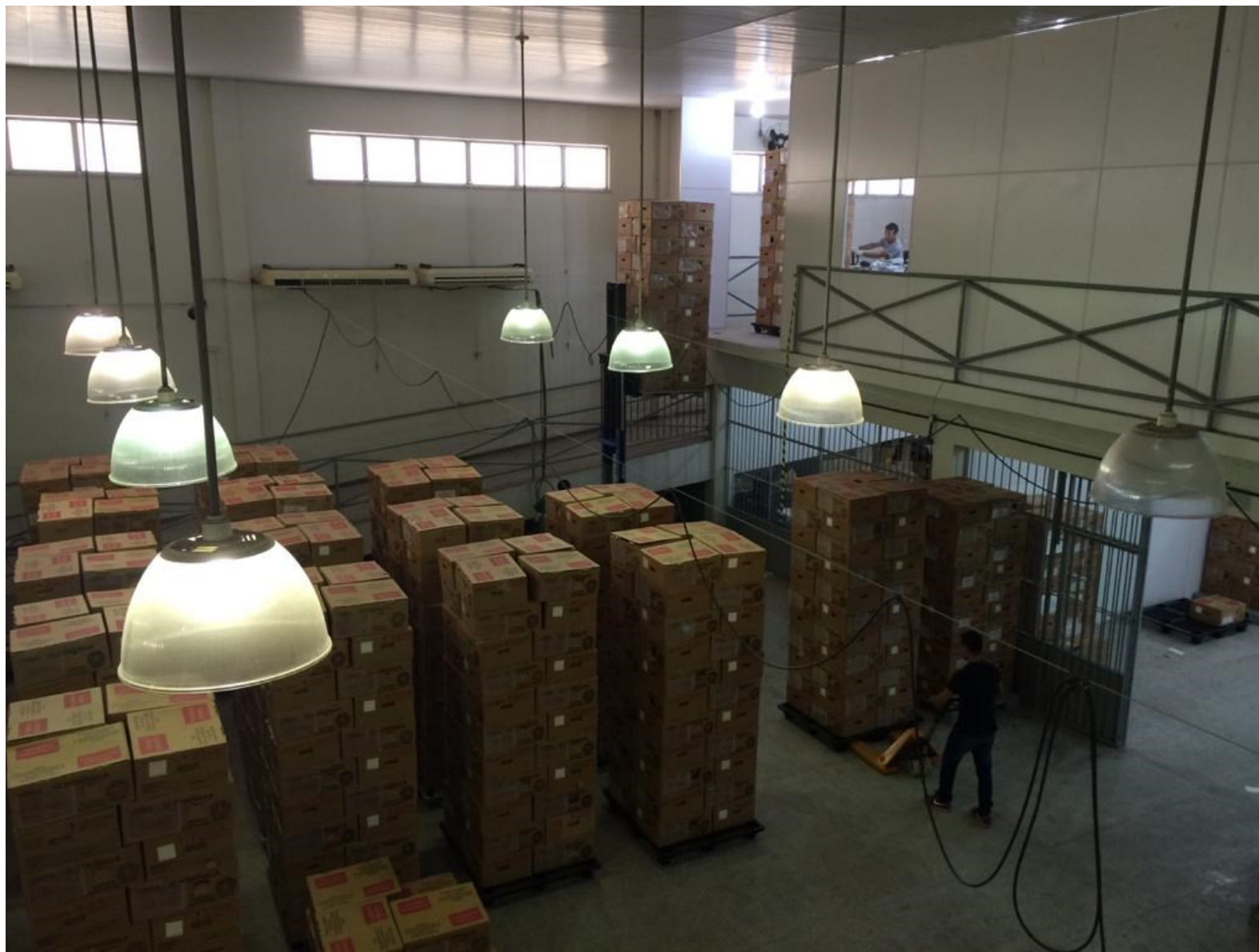
Imagem 12 – Preparação de embarque de urnas para a Eleição