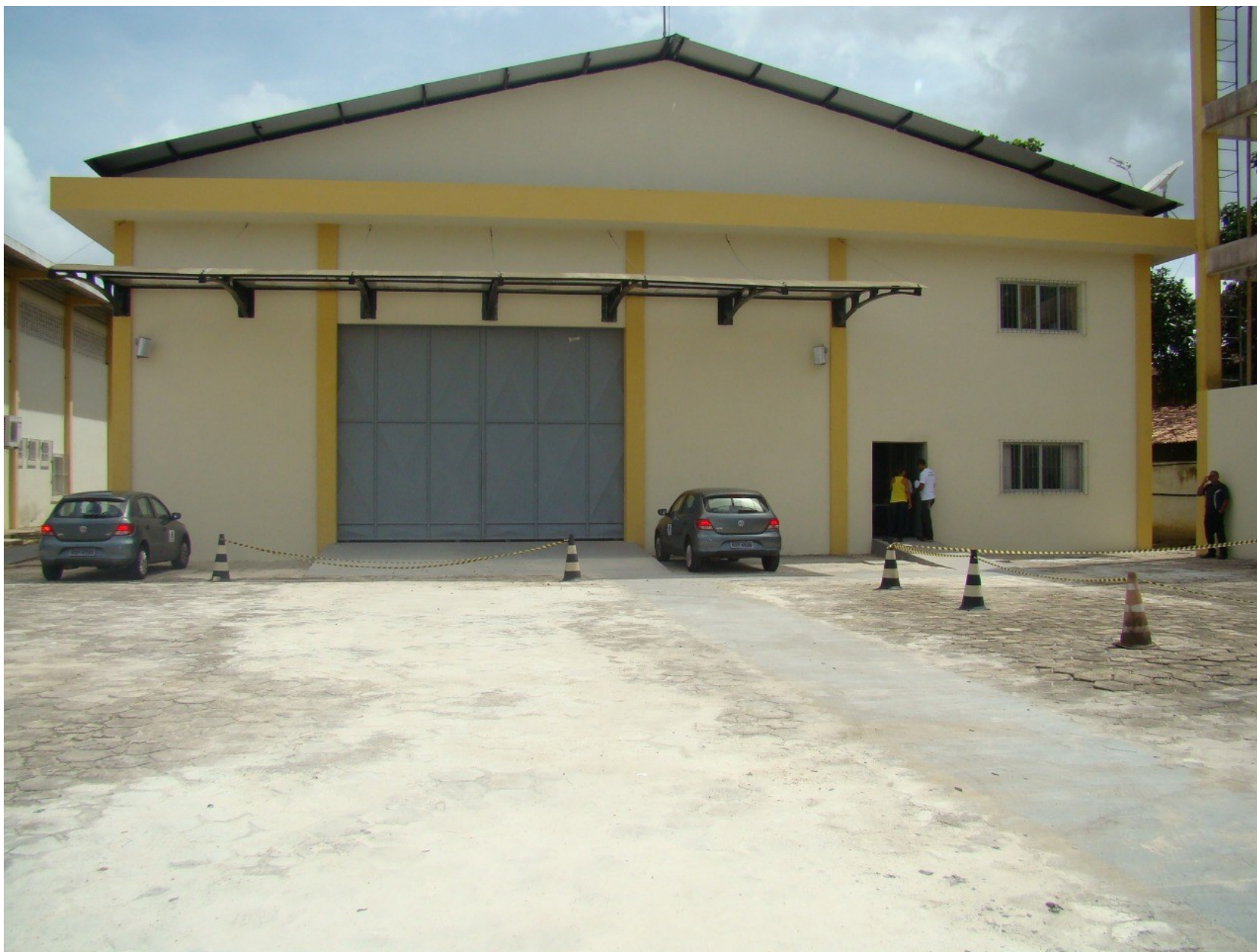
Imagem 02 – Fachada externa – Visão interna dos portões frontais de acesso.