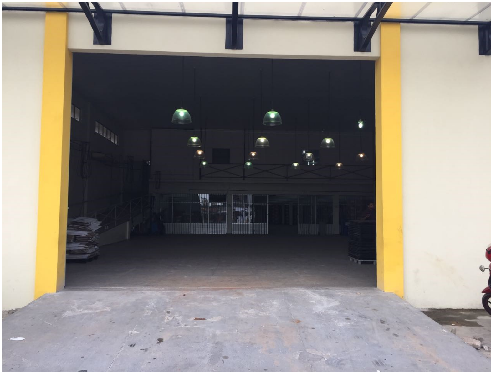
Imagem 06 – Portão de embarque e desembarque aberto