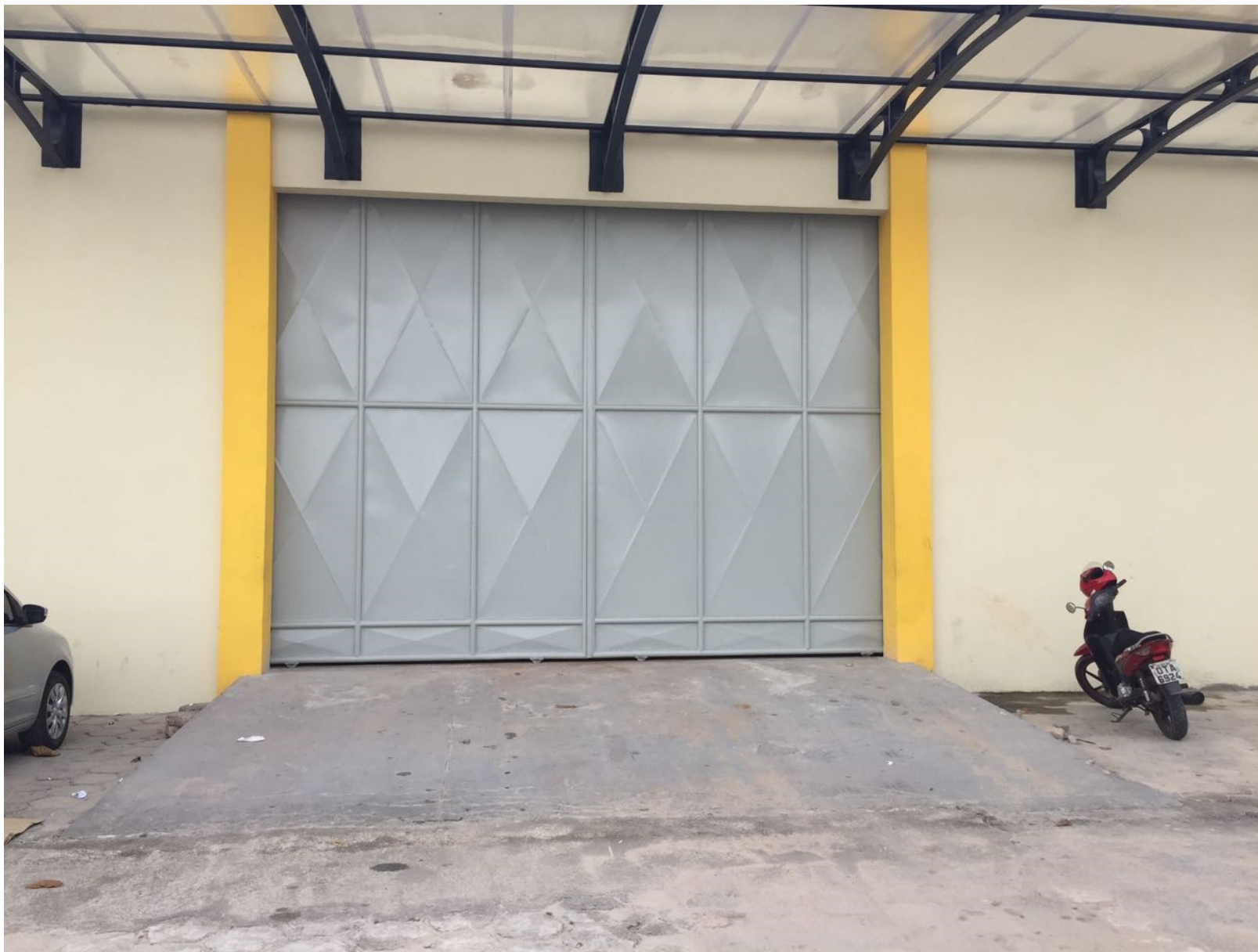
Imagem 05 – Portão de embarque e desembarque de materiais.